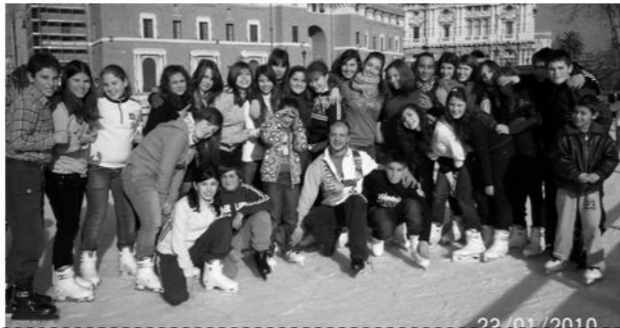
Il Gruppo Adolescenti sulla pista di pattinaggio sul ghiaccio a Castel Sant'Angelo Roma 23-01-2010