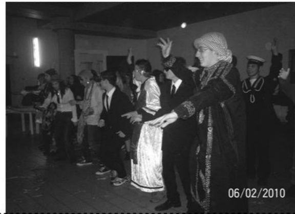
I ragazzi scatenati alla Festa di Carnevale Parrocchia, 6-2-2010