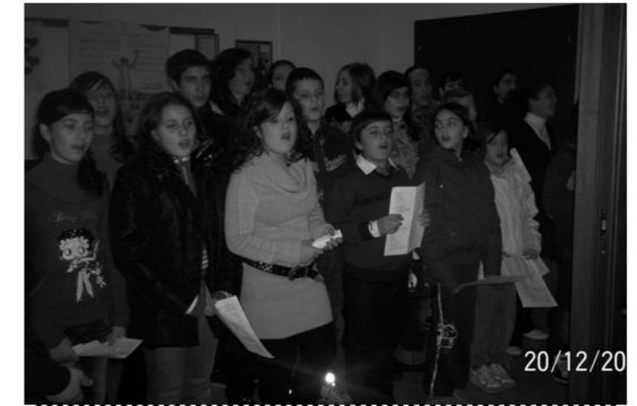
Le ultime prove prima del concerto di Natale Parrocchia 20/12/2009

|| Vuoi imparare a suonare la chitarra? || || Ti aspettiamo ogni sabato pomeriggio dalle ore 15.00 alle ore 16.00 || || nei locali della parrocchia. ||