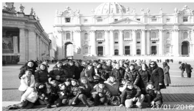
Il Gruppo Adolescenti davanti la Basilica di San Pietro Roma 23-01-2010