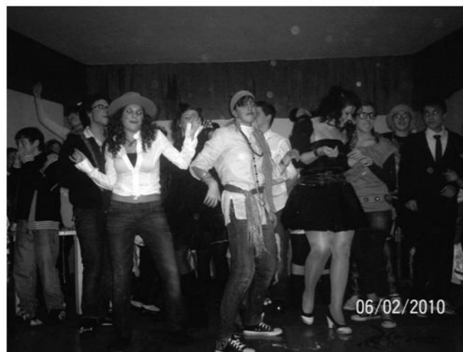
I ragazzi scatenati alla Festa di Carnevale Parrocchia, 6-2-2010