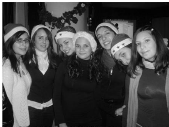
Le "Tomboline" Parrocchia, 11-12-2009