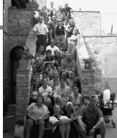
ALCUNI MOMENTI DI S. VENANZO (PG)

La sua capacità nel definire le varie sfumature di colore di montagna, alberi, mare quasi avesse la percezione che io non le avessi mai osservate. Ho scoperto così che avevo incontrato una persona ricca di interesse, piena di voglia di vivere, capace di ridere e scherzare anche delle sue problematiche ed aveva il coraggio di affermare che la vita è comunque bella e vale la pena di essere vissuta! Solo una volta ho colto una nota di tristezza nella sua voce quando mi ha confidato che in realtà lui è soddisfatto della sua vita perché fa un lavoro che gli piace e lo interessa, ma dice cambiando tono, che quando cammina per strada nessuno lo saluta, nessuno lo vede eppure lui conosce tanta gente e distingue perfettamente le voci di chi frequenta. In quel momento, dice continuando,