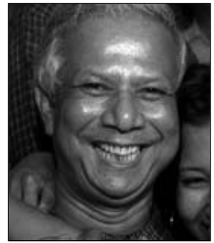
YUNUS, NOBEL PER LA PACE

Piccoli "GRANDI" uomini che cambiano il destino di migliaia di persone... ma anche tu puoi avere un ruolo importante e non fermarti a "semplici gesti di carità". Rifletti come consumatore su qual è il tuo ruolo in questo società consumistica: dove tiene i tuoi risparmi? che tipo d'acquisti fai? quale impatto ha nella società il tuo stile di vita? Insomma, non placare la tua coscienza, cerca di metterla in discussione... soprattutto a Natale e non solo.