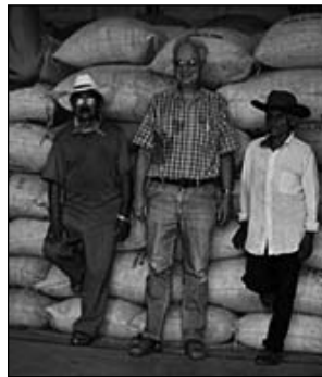
FRANZ VAN DER HOFF, PIONIERE DEL COMMERCIO EQUO

dimensione nuova. La malattia con la sua sofferenza diviene presenza stabile ed immanente che condiziona la vita. Crolla, brutalmente, la speranza, a lungo vezzeggiata, di una possibile quanto improbabile guarigione, instaurandosi, così, un meccanismo di adattamento e convivenza. Il rapporto fra corpo e psiche si manifesta in tutta la sua complessità indicando il disagio di una disfatta imminente in cui paura, angoscia e depressione si inseguono generando un vortice di emozioni. Sono sintomi dap-